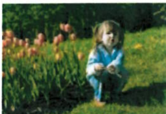
In de tuin