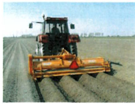
Op de boerderij