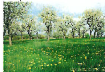
Op de weide