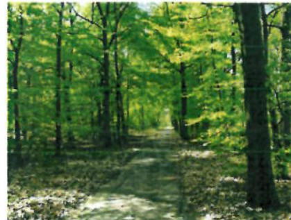
In het bos