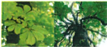
de wilde kastanje