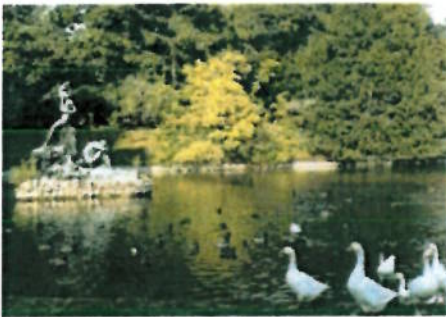
In de vijver