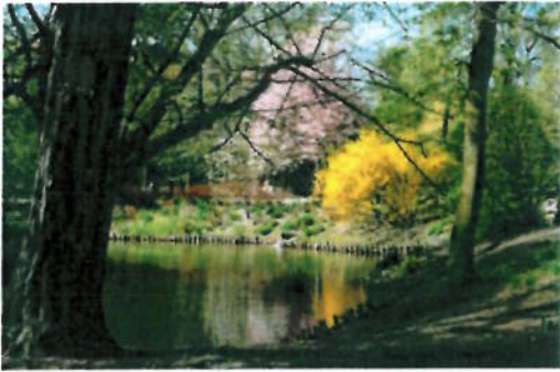
In het park

3. Kruis bij elke foto de juiste zin aan.